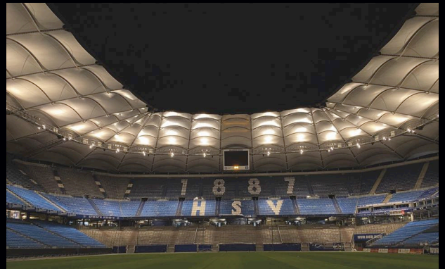
VOLKSPARKSTADION HAMBURG RGBW Flutlicht UEFA ELITE LEVEL A zertifiziert.