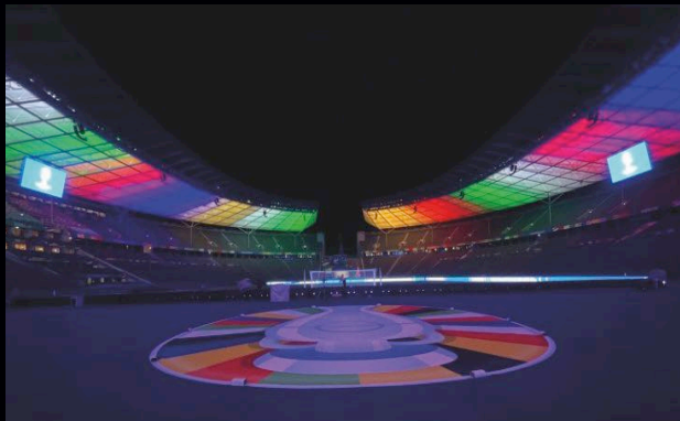
OLYMPIASTADION BERLIN Einzigartiges LED-Upgrade für Top-Events.