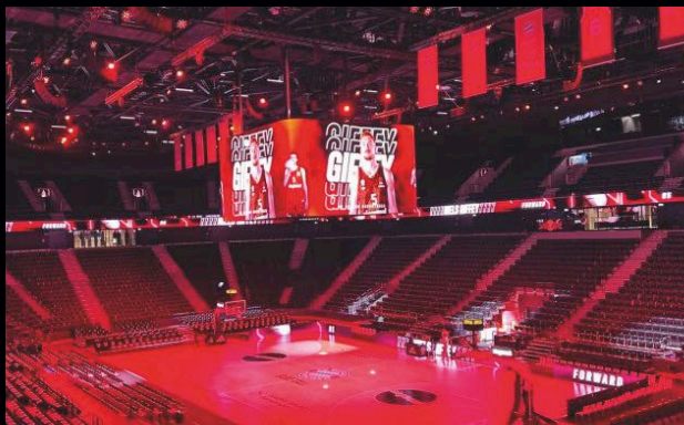
SAP GARDEN MÜNCHEN Dynamische Beleuchtung für Arenen & Konzerte.