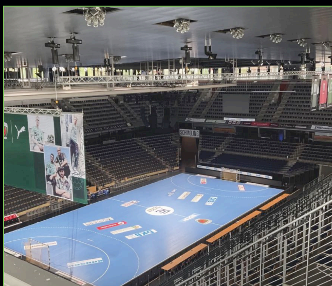
Max Schmeling Halle - Berlin