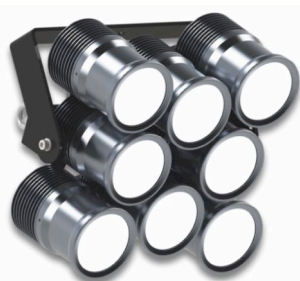
RALED FLOOD 120-08 Stadionleuchte mit vollfarbiger LED-Technik