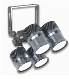
RALED FLOOD 120-04 Sportplatz- und Eventleuchte mit vollfarbiger LED-Technik