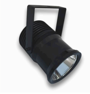
RALED SPOT 120-01 Eventleuchte mit vollfarbiger LED-Technik