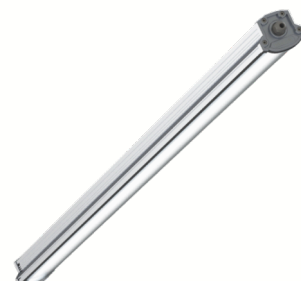
RALED LINE 1500PC Vollfarbige lineare LED-Leuchte