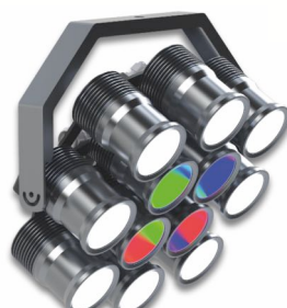
RALED FLOOD 120-12 Stadionleuchte mit vollfarbiger LED-Technik