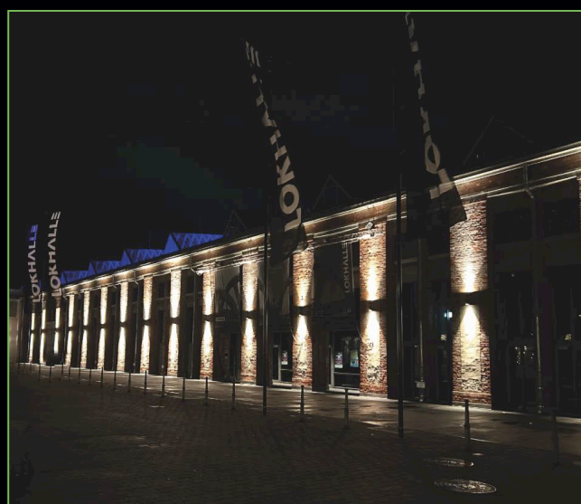
Lokhalle - Göttingen