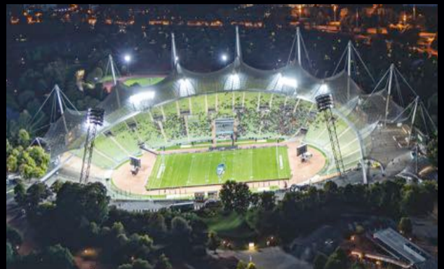
OLYMPIASTADION MÜNCHEN Einhaltung des Denkmalschutzes.