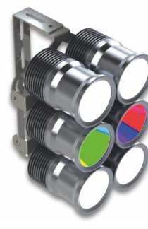
RALED FLOOD 120-06 Stadionleuchte mit vollfarbiger LED-Technik